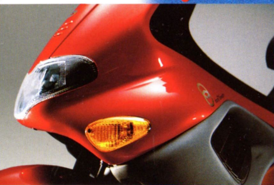
Sportliches Frontdesign mit verstellbaren Luftschlitzen