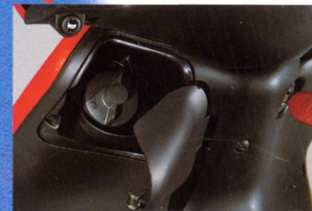
Benzintank mit aufklappbarer Blende